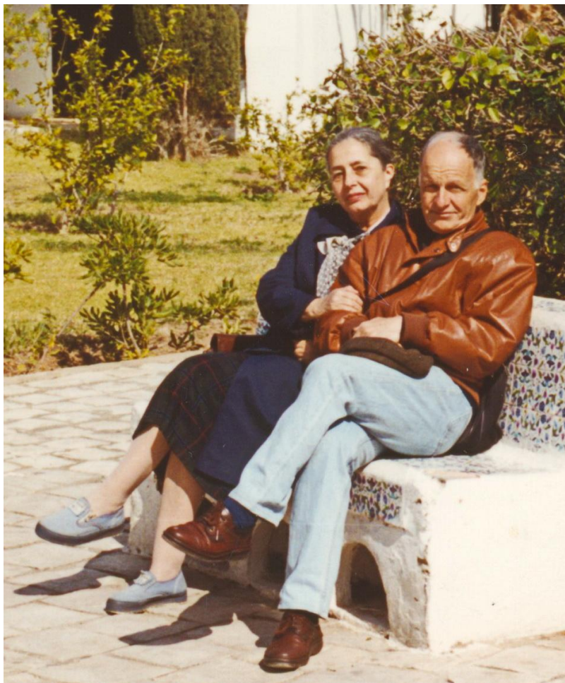
Cu Tața, în excursia din Portugalia, 1993.

căutam, se înșirau blocuri modeste, de 3-4 nivele, cu tencuiala scorjită, cu balcoanele încărcate de rufe întinse la uscat - contrastând izbitor cu clădirile învecinate.